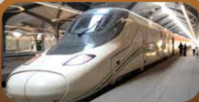
Haramain Highspeed Railway