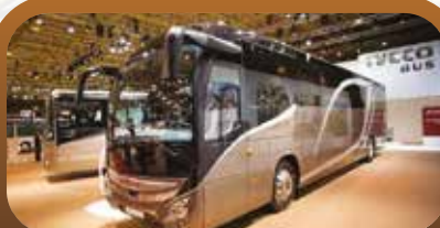
Private Bus AC