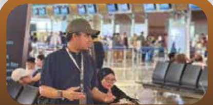
Muthawwif & Tour Leader yang berpengalaman