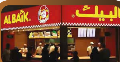
Paket ayam Al-Baik