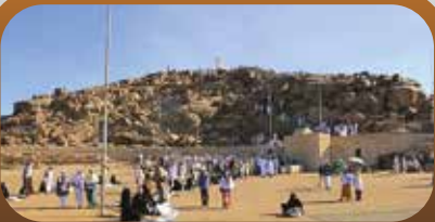
City tour Makkah & Madinah