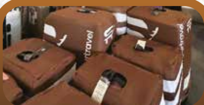
Full Handling dari Mulai keberangkatan